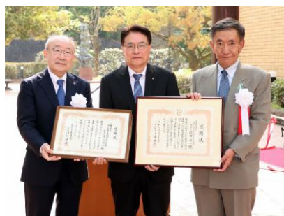
瀬戸市、大せともの祭協賛会