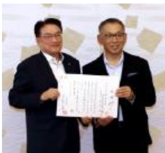
豊田市小原観光協会