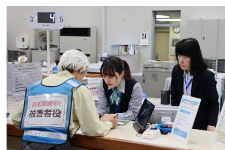
特殊詐欺被害防止訓練