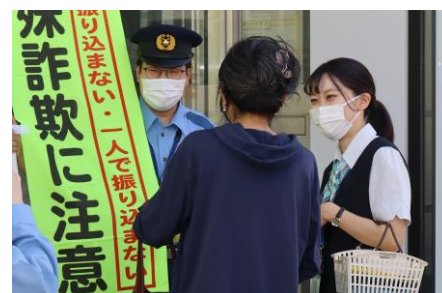
特殊詐欺被害防止の啓蒙活動