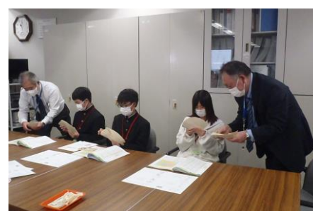
中学生の職場体験