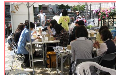
堀川フラワーフェスティバル 絵付け体験の様子