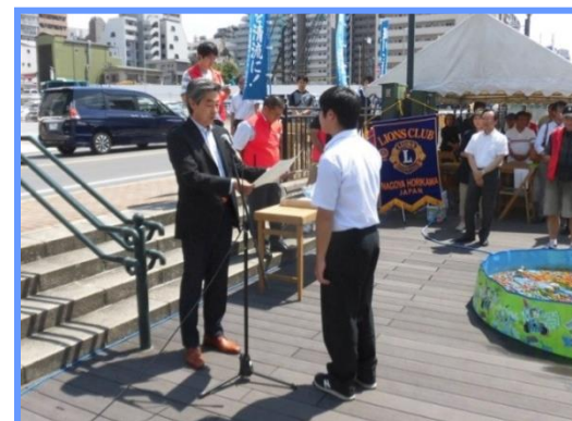
堀川エコロボットコンテスト2019