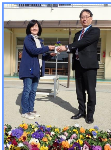
幼稚園での贈呈式

瀬戸市、尾張旭市、 長久手市、名古屋市、 春日井市、豊田市 北名古屋市、清須市、 小牧市、日進市、 愛知郡東郷町