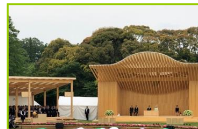
第70回 全国植樹祭あいち2019 愛知県森林公園（尾張旭市）を式典会場として開催