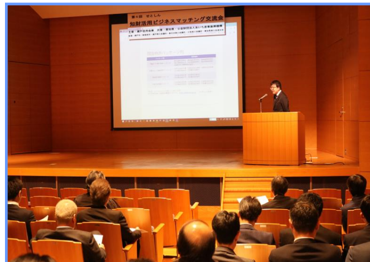
第6回 令和元年11月20日開催